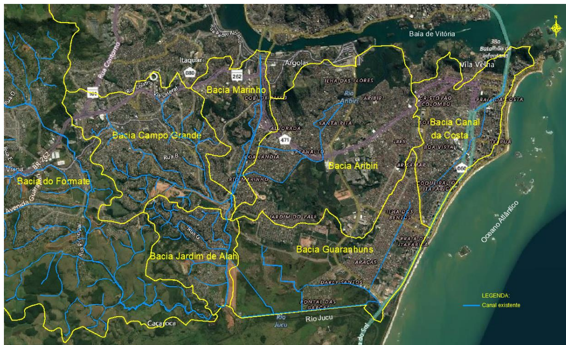
Figura 1 – Identificação das Bacias Hidrográficas de Vila Velha e Cariacica

GOVERNO DO ESTADO DO ESPÍRITO SANTO Secretaria de Saneamento, Habitação e Desenvolvimento Urbano