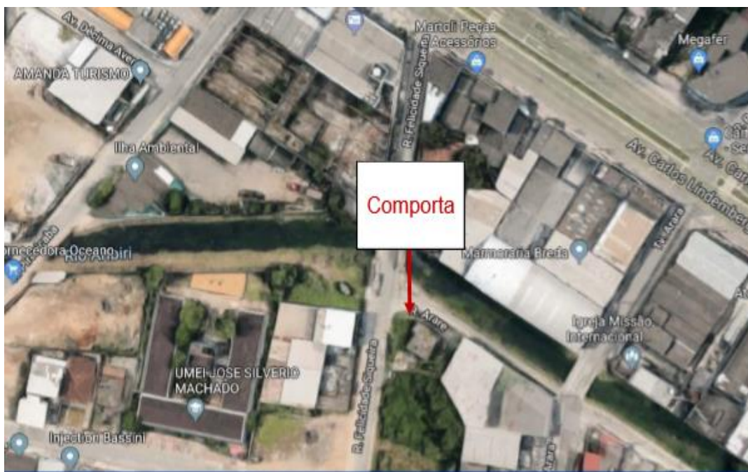
Figura 3 – Comporta a ser instalada na Rua Felicidade Siqueira

Outro sistema de comportas será instalado na travessia da Rua Felicidade Siqueira sobre o Rio Aribiri, conforme Figura.