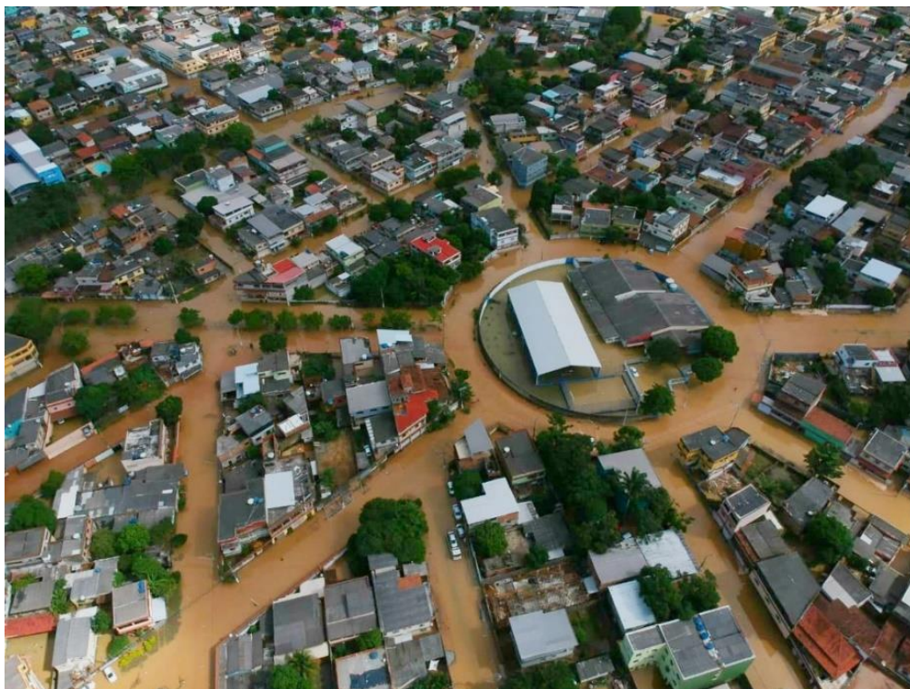
Figura 2 – Bairro Cobilândia, Vila Velha